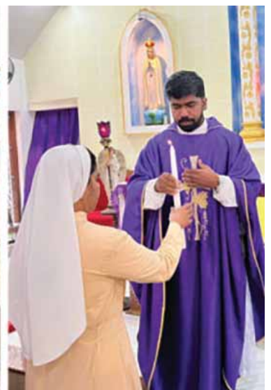
തിരുവനന്തപുരം ലത്തീൻ അതിരൂപതയിലെ വിശുദ്ധ യൂദാ തദേവുസിന്റെ നാമധേയത്തിലുള്ള കാച്ചാണി ഇടവകയിൽ ഹോം മിഷൻ പ്രവർത്തനങ്ങൾക്ക് തുടക്കം കുറിച്ചപ്പോൾ